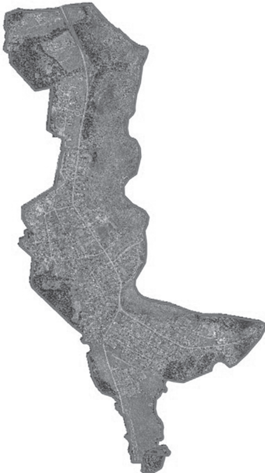
Схема границ территории, в отношении которой разрабатывается проект межевания застроенной территории

Приложение № 1 к постановлению администрации городского округа Ревда от 30.05.2024 г. № 1575