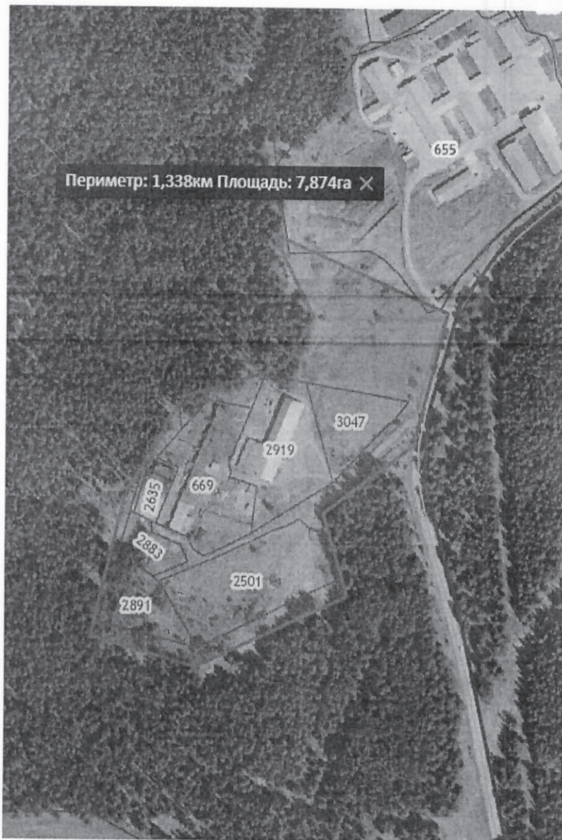
Схема территории проектирования